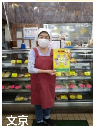
文京 丸十ムラタパン 様