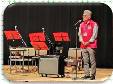
開会の挨拶 渋谷地区社協会長