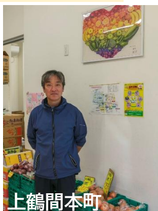
上鶴間本町 市川ストアー 様