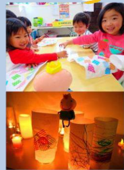
火を灯すと幻想的な空間に・

などのメッセージが発表され、来場者や関係者、そして作者の心が響き合う夜になりました。終了後も会場に残り、詩の感想を語り合う方がたくさん。キャンドルの灯りはしばらく消えることなく、集う者の笑顔を静かに照らしていました。