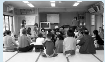
子ども達から手品の披露! ~世代を超えた和やかな「やすらぎステーション」も開催しています~

鳥屋支部では、毎年10月には鳥屋小学校で福祉バザーを行い、自主財源の確保にも努めています。「こうした地道な活動も、“つながり”の一助として、少しでも笑顔が飛び交うひと時になればと願っています。」と、支部長はお話され、人間味あふれる温かな気持ちを伺わせていただきました。