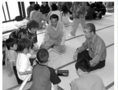
地域の世代間交流にも

なお、市社協では賛助会費を地区社協への配分以外にも広報啓発事業やボランティア育成事業など、広く地域に還元できる事業に活用させていただいています。