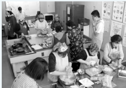
1月はお好み焼きを作りました!

3月(28日)は、みんなでウォーキングの予定です。参加者は高校生以上ならどなたでも歓迎ですよ!