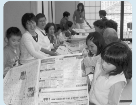
子どもと一緒に楽しみながら地域のふれあいを育む~やすらぎステーションより

平成19年度の青根支部やすらぎステーションへの参加者は子どもを含めると延べ791名でした。「月平均65名。住民の10人に一人は毎月社協の事業に参加いただいています。少子・高齢化社会にあって、小地域の住民活動について、何がしかのお役立ちできたら、役員一同こんなに嬉しいことはないですね。」と皆で地域を支える気概を感じさせていただきました。