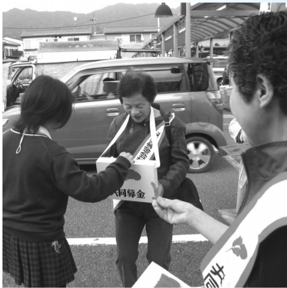
街頭募金の嬉しい一幕。温かな気持ちが伝わります。