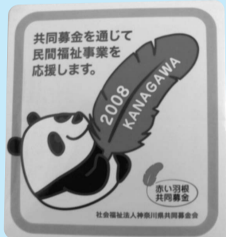
法人・企業の方の「協力店シール」