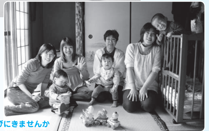
おうちにあそびにきませんか