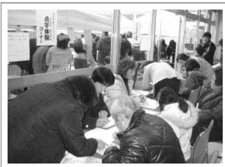
『福祉体験コーナー』

城山町内のボランティアグループ、福祉グループ、福祉施設、福祉関係者による車いす体験・手話体験・高齢者疑似体験などの「福祉体験コーナー」をはじめ人形劇・楽器演奏・手話コンサート・福祉映画会などの「催し」、町内のボランティアグループ・福祉グループなどの「活動紹介パネル」、『模擬店』など各種催し物を行いました。当日は、小さいお子さんから高齢の方まで約1000人の方にお越しいただき、盛大に開催することができました。