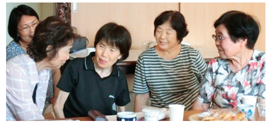
楽しい会話があちこちから聞こえてきます

日時 10月1日(日)午後1時～4時 場所 ソレイユさがみ セミナールーム 申込 直接会場へ。入退場自由 問合せ 相模原市社会福祉事業団 電話 ☎042-758-2121