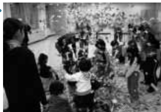
障害児とボランティアで組織された「たけのこクラブ」のメンバーが、クリスマス会で楽しくゲームをして過ごしました。

また、12の各地域と連携しながら、サロン等の地域住民の活動を支援し、福祉のまちづくりを進めます。