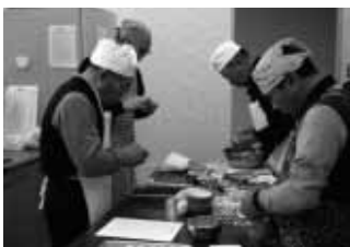
毎月、ひとり暮らし等の男性高齢者を対象に「男性料理教室」を開催しています。皆さん楽しみながら腕前も上がっています。

見守り支援ネットワークづくりは、自分らしい生活を住み慣れた地域で送っていただけるように、困りごとの早期発見・対応につながる見守りや支援の輪・和を皆さんと協力しながらつくっていきます。