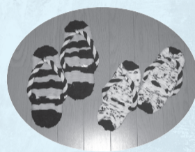
「健康にもよい布草履」

家庭にある、着なくなった服などの布をリサイクルした布草履は、家の中ではなく草履です。「健康にも良く、家にもやさしい草履です。皆さんもぜひ挑戦してみてください」と話してくれました。今後ますます自然のパワーをもらって、藤野のために活躍してくださいね。