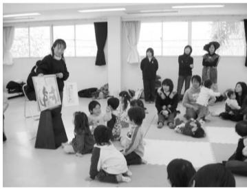
紙しばい 次のどうなるのかな?

今回紹介するのは、平成7年6月からパネルシアターを使い子育てサロンや幼稚園・小学校で子どもたちに民話や童話のお話をしている「おはなしでんでんむし」です。