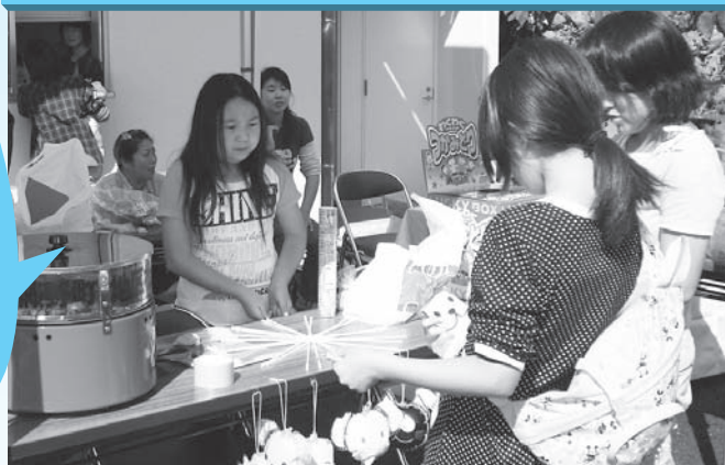
地区社協の財源確保の一環として駄菓子などの販売を行いました。