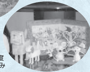
平成20年度 千支のねずみ