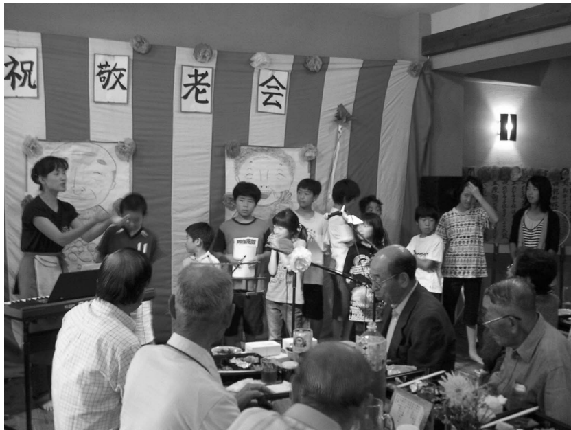
いつまでもお元気で!

地元住民が主体となって、自然体験プログラムや芸術体験プログラムの提供、炭焼き、カフェの運営、野鳥観察・保護活動、子育てサロンの開催など、様々な活動が行われています。昨年度の利用人数は延べ4,100人、宿泊人数は延べ1,500人に上っています。スタッフの一人は「昔ながらの里山の自然と文化を生かして、生き生きとした、住みやすい地域づくりを進めていきたい」と語ってくれました。篠原の里センターを拠点に、子育てから高齢者支援まで地域一丸となった幅広い活動が展開されることを期待します。