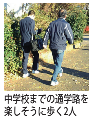
中学校までの通学路を楽しく歩く2人

緑ボランティアセンター(以下、センター)では、高齢者や障がいのある方、福祉施設などからの依頼を受け、活動希望者に紹介しています。依頼者の生活に欠かせないものや一緒に楽しむものまで、様々な活動があります。