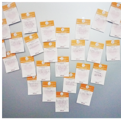
寄せられたメッセージの数々