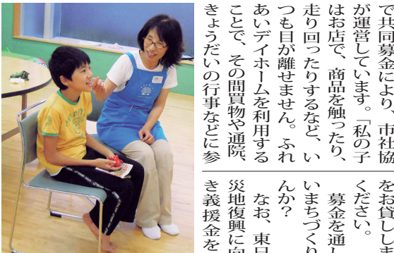
募金の配分や使い道の詳細は、中央共同募金会ホームページで。

募金方法 自治会や学校、街中の募金のほか、市社協窓口でも受付しています。また、職場に募金箱を置いてご協力くださる企業には募金箱をお貸しします。ご連絡ください。