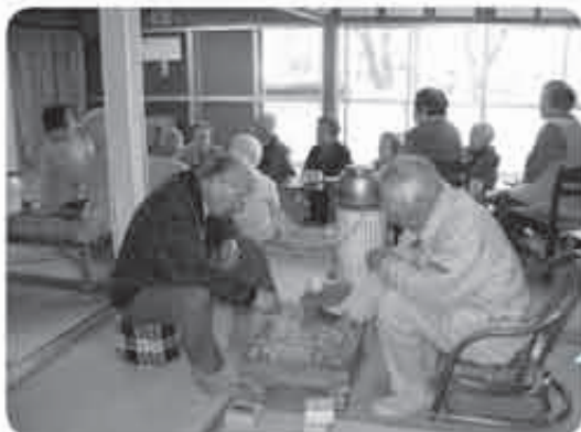
【いきいきサロン優遊】

火曜日(第1火曜日を除く)に、又野自治会館にて午前10:30～午後3:00頃まで開催しています。 好きな時間に顔をだして、会話、レクリエーション等を楽しめるので元気でいられます。 と参加者の方から・・・