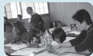
ふくしの集いより