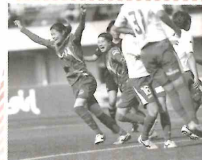
©Nojima Stella Kanagawa Sagamihara