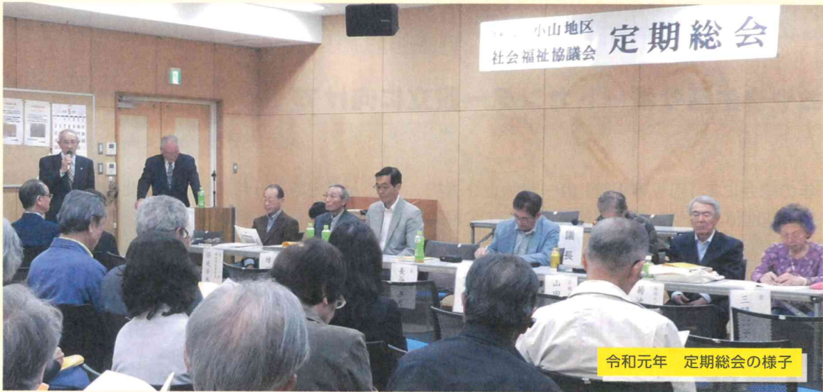
令和元年 定期総会の様子

次第に沿って進められた総会でしたが、議題が「おやま生活サポートセンター」に及ぶと一転し、白熱した討議が展開され、予定終了時間を大幅に超える事態となりましたが、最後には参加者の総意を得ることが出来、無事に総会は終了となりました。