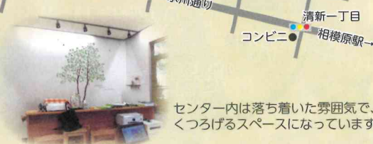
センター内は落ち着いた雰囲気、くつろげるスペースになっています