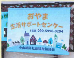
このタペストリーが目印です！