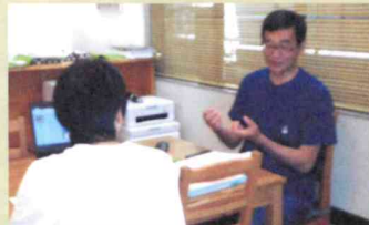
登録して頂いたボランティアさんへの説明風景