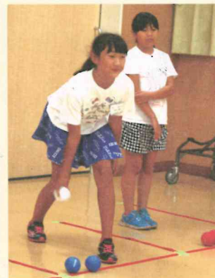
ジャックボール、どこに投げようかな。