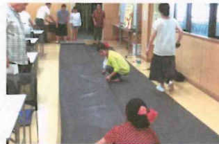
防音シートの準備