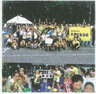
H29年度 運動会の様子