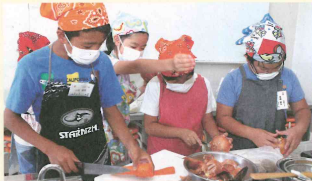
指を切らないように気をつけよう!

最後に、お忙しい中お手伝いくださいましたボランティアの皆様へ感謝申し上げます。ご協力ありがとうございました。