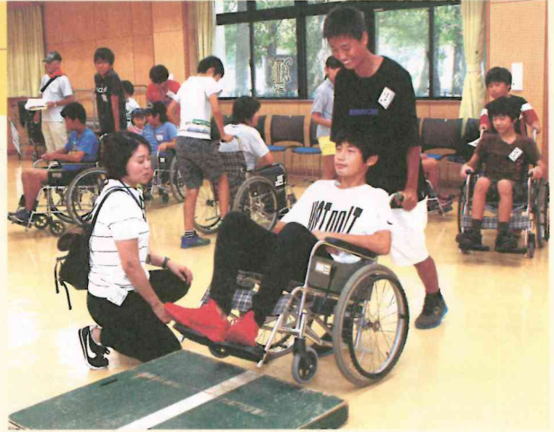
車いすでうまく上れるかな?

車いすの体験から、自分たちの好みに作り上げたカレーの味覚、そしてボッチャ競技に、仲間同士の連携と協力、また弱者への思いやりと優しさの重要性を学んだ今回の福祉体験を、いつか地域の活動等に活かしてもらえらば、開催した意義が大きいものであったと思っています。