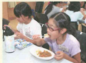
カレー、おいしいじゃん!