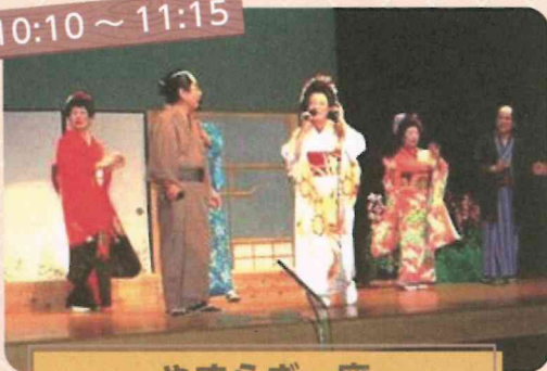
やすらぎ一座 おいてけぼりかっぱ騒動記