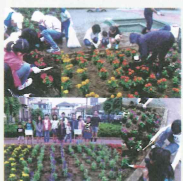
花壇の植栽の様子

私たち「氷川町子ども会」は、年間を通していろいろな活動を行っています。6月と11月には、地域の方々と氷川町公園の花壇の植栽を行い、公園を華やかにしています。また、歓迎会、夏まつり、クリスマス会などのイベントにも積極的に、学年を問わず仲が良く、参加率の高さに驚かされます。そして、黄色いTシャツでおなじみの地区運動会では、子ども達と地域の方々が一致団結し、楽しい思い出と良い経験ができています。さまざまなイベントを通じて子ども達の成長を見られることが本当に嬉しいんです!!